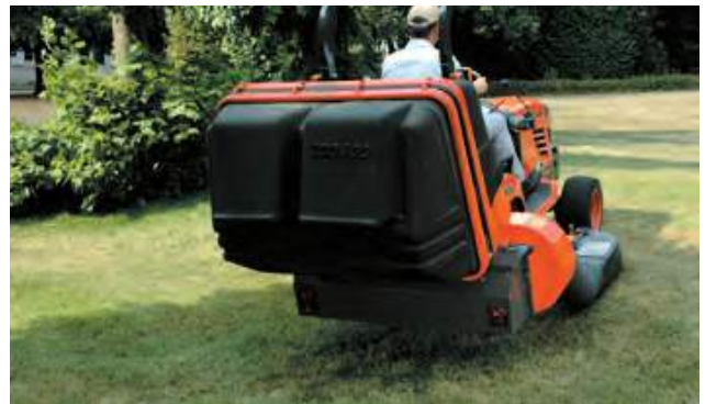
CESTO CON SCARICO BASSO

PNEUMATICI INDUSTRIALI PNEUMATICI GIARDINAGGIO PNEUMATICI AGRICOLI