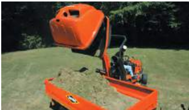
CESTO CON SCARICO ALTO