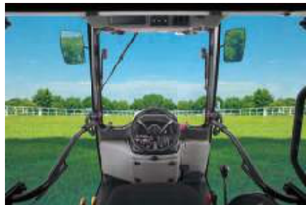
BX231 Optional CAB