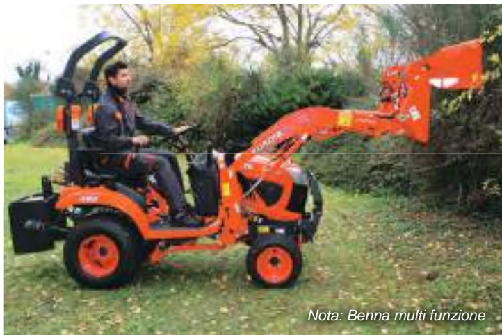
Nota: Benna multi funzione

Il trattorino versatile BX231 è facile da guidare e da manovrare, per dedicarsi in tutta sicurezza anche alle operazioni di taglio più impegnative. Non più lungo di un normale trattore da giardino, il BX231 passa facilmente tra gli alberi e in altri punti stretti del giardino. Inoltre, le sue dimensioni compatte lo rendono delicato sul manto erboso.