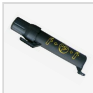
KIT PORTA INDUMENTI - DOCUMENTI (PIND)