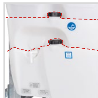
CISTERNA LAVAMANI E LAVAIMPIANTO INTEGRATE