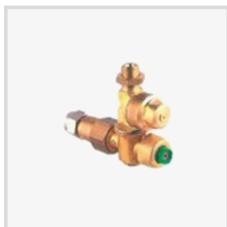
GETTO A CANNONCINO CON ANTIGOCCIA (M2001623)

SUPPLEMENTO KIT APERTURA/CHIUSURA LATERALE INDIPENDENTE DELLE USCITE D'ARIA CE 2009/127 SUPP12