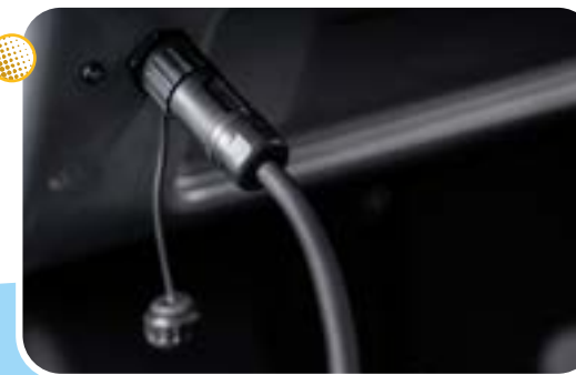
Preso per la ricarica Charging plug Prise pour la recharge Steckdose zum Aufladen