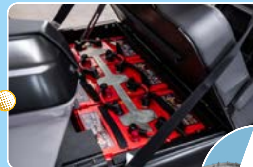
Vano Batterie Battery tray Compartment de la batterie Batteriefach