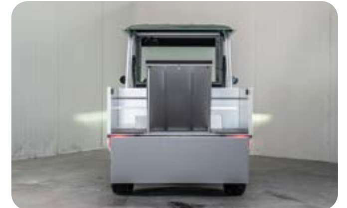
Vano di carico | Cargo bed | Caisse arrière | Ladefläche