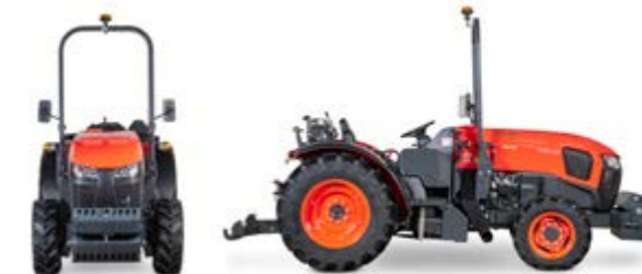
E' inoltre disponibile una versione con arco di protezione (ROPS).

La trasmissione in due varianti soddisfa ogni necessità per un utilizzo senza fatica in frutteti e vigneti.