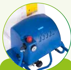
REGOLATORE DI PRESSIONE E MANOMETRO