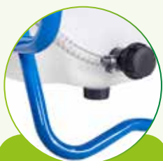
FILTRO ASPIRAZIONE ESTERNO