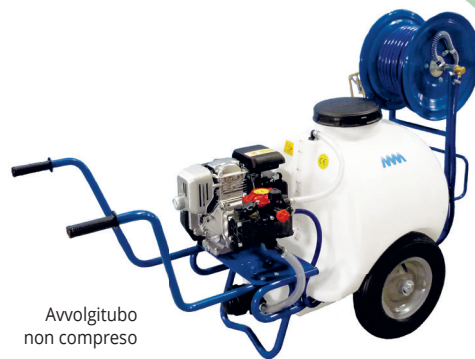
Avvolgitubo non compreso