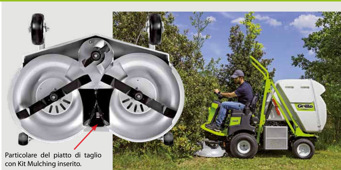
Particolare del piatto di taglio con Kit Mulching inserito.

L'intero apparato di taglio con trasmissione primaria cardanica e secondaria a cinghia, può essere ribaltato per ispezione, manutenzione delle lame e pulizia, senza necessità di attrezzi, senza dover scollegare gli organi di trasmissione né il condotto di carico dell'erba. Inoltre l'angolo di ribaltamento del piatto di taglio risulta particolarmente efficace grazie ad un semplice sistema che permette di sollevare e bloccare la pedana poggia piedi in posizione rialzata (vedi foto).