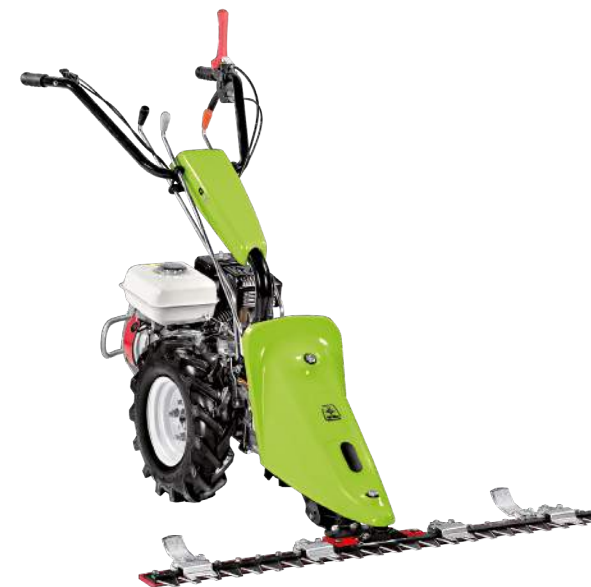
G 84 con barra falciante