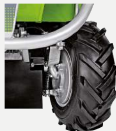
Particolare protezioni antierba

Per aumentare ulteriormente la sicurezza dell'operatore in discesa, sono dotati di freni di servizio a tamburo sulle ruote anteriori azionabili tramite pedale, combinati con il bloccaggio differenziale offrono l'aderenza massima.