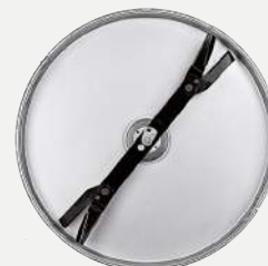
E' possibile montare sul piatto l'accessorio KIT MULCHING

L'apparato di taglio mono-lama ha una larghezza di lavoro di 91 cm . La struttura dell'intero apparato di taglio non teme urti con sassi. L'albero lama di grande diametro e la trasmissione di taglio garantiscono affidabilità anche nelle condizioni di lavoro più gravose per tante ore in assoluta sicurezza. L' altezza di taglio varia da un minimo di 3 a un massimo di 9 cm.