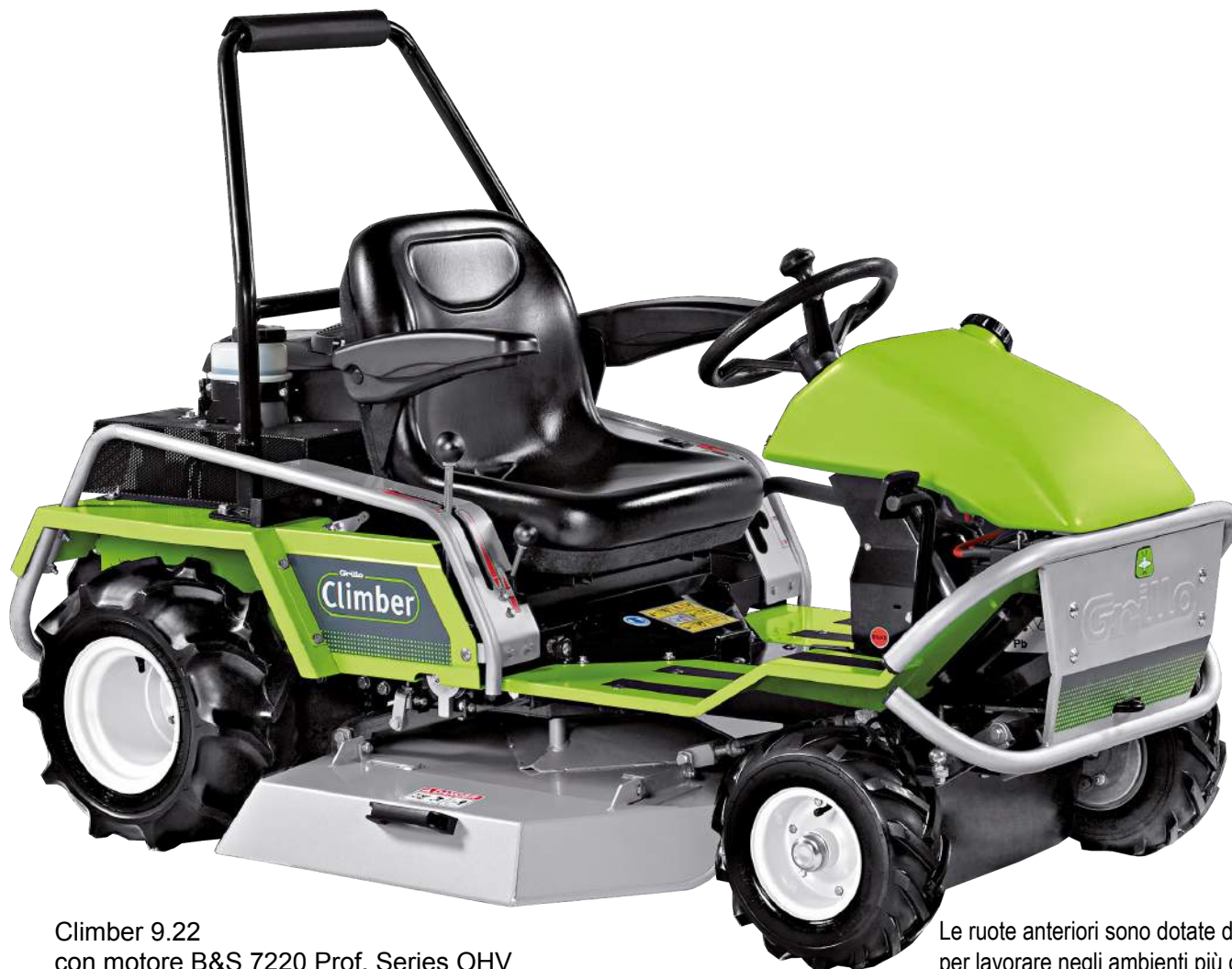
Climber 9.22 con motore B&S 7220 Prof. Series OHV

Trinciaerba idrostatico a lama estremamente robusto, dotato di bloccaggio differenziale e freni di servizio sulle ruote anteriori, ideale per il taglio di erbe alte e arbusti legnosi anche in condizioni di pendenza e terreni irregolari. Climber 9 riesce ad arrampicarsi in tutta sicurezza, è efficace nella pulizia di aree rustiche, in agricoltura, nei lavori sottochioma, nella manutenzione del verde professionale e per ogni utilizzo intensivo . È maneggevole, lo sterzo morbido e la velocità di lavoro, rendono questo trinciaerba estremamente efficace ed efficiente, piacevole da utilizzare. È compatto, con baricentro basso e una ottimale distribuzione dei pesi, offre massima stabilità e sicurezza per l'operatore in ogni condizione di lavoro.