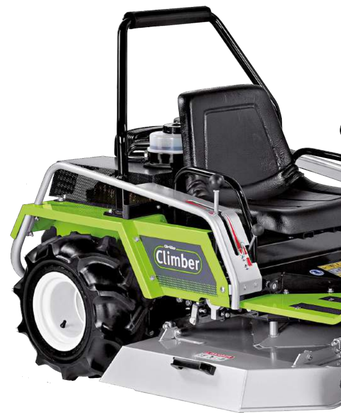
Le ruote anteriori sono dotate di trattamento antiforatura per lavorare negli ambienti più ostili!