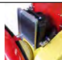
Scambiatore di calore Heat exchange system