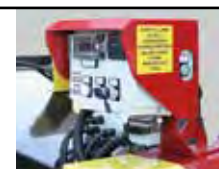
Visualizzatore giri elettronico NO-STRESS Electronic speed controller NO-STRESS