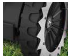
Ruota Posteriore Dentata (Su richiesta) Toothed Rear Wheel (Optional)