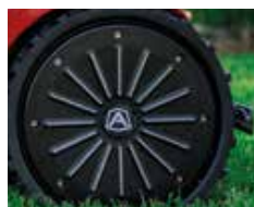
Ruota posteriore gommata Flex rubber rear wheel