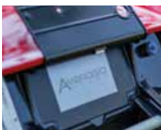
Display Touchscreen Touchscreen Display

Batteria litio-ioni 7,5 Ah 7.5 Ah lithium-ion battery