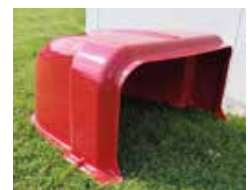
Copertura base di ricarica (su richiesta) Recharging base cover (optional)