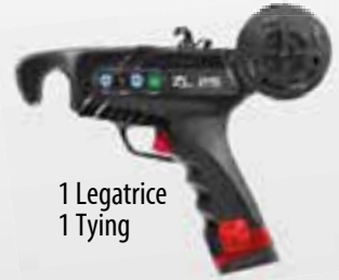
1 Legatrice 1 Tying