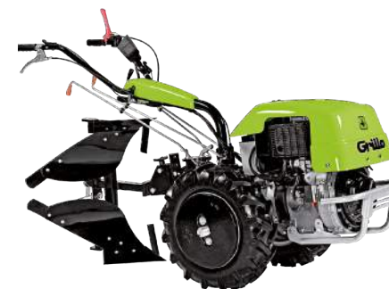
G 131 con Kit aratura