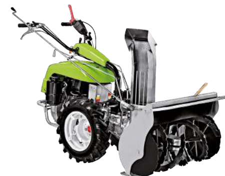
G 131 con spazzaneve a doppio stadio