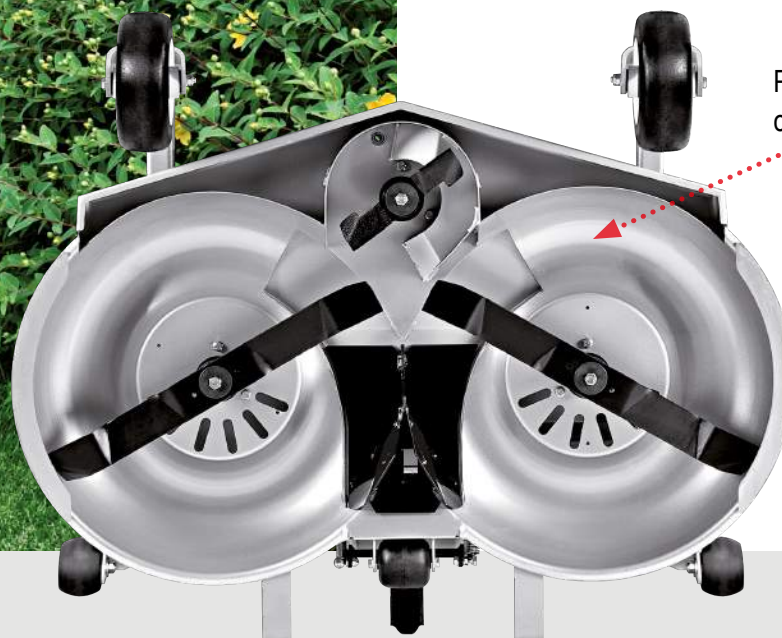
Particolare del piatto di taglio con Kit Mulching inserito.

Il freno di stazionamento è a disco di tipo "attivo": quando è inserito permette di scendere dalla macchina con motore acceso se la funzione di taglio è disinnestata (massima sicurezza).