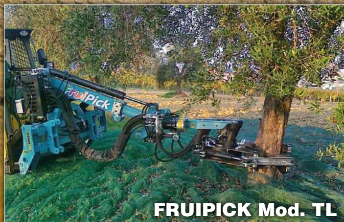
FRUIPICK Mod. TL