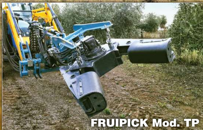
FRUIPICK Mod. TP