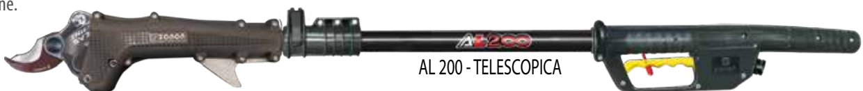
AL 200 - TELESCOPICA

Tijera electrónica con doble posición de apertura, equipada con batería de LI-ION de 2,9 Ah con unidad de control incorporada, montada en un arnés tipo mochila, convertible en cinturón a través de una cremallera. Batería del tipo reversible para ser utilizada por diestros o zurdos, cable de conexión a la tijera reforzado, fuente de alimentación para cargar la batería. La batería de LI-ION puede trabajar hasta dos jornadas de trabajo seguidas sin ser cargada (dependiendo de la cantidad de cortes y de la intensidad de los mismos). Tiempo de recarga de la batería: 3/5 horas. Ruido emitido 60dB(A) con una emisión inferior a 2,5m/s 2 de vibración